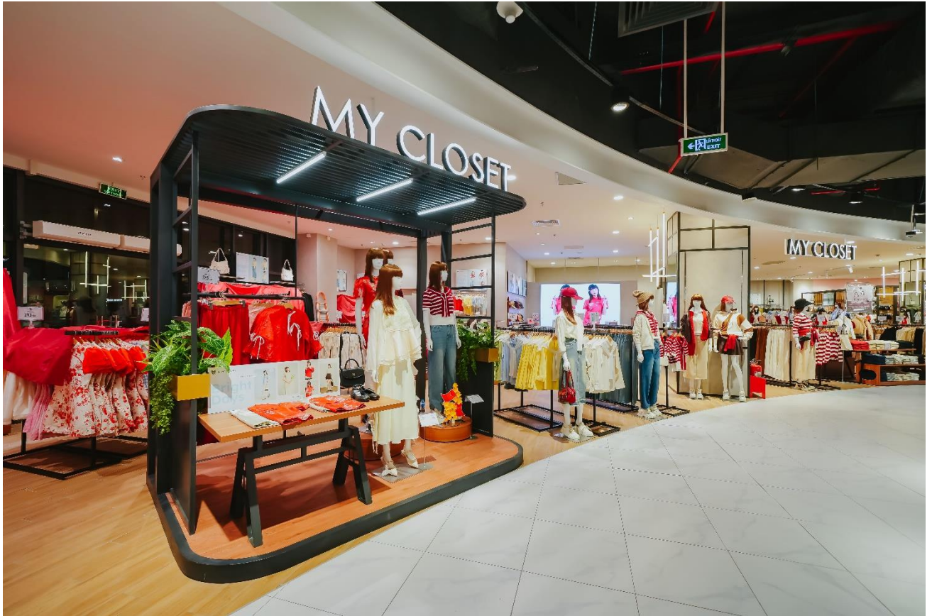
Thời trang mới theo xu hướng tại MY CLOSET