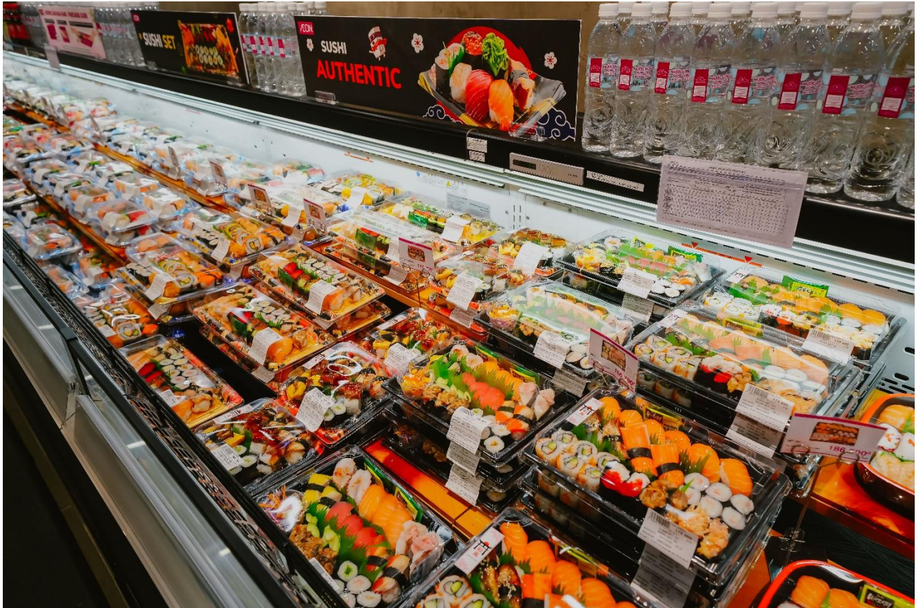
Thiên đường ẩm thực tầng 3 tại AEON Xuân Thủy

Tầng 3 là thiên đường ẩm thực với hơn 10 gian hàng đa dạng. Nổi bật là Yatai Yokocho, một thương hiệu Nhật Bản lần đầu tiên có mặt tại Việt Nam, và Kuma Pizza – sự giao thoa tinh tế giữa nền ẩm thực Nhật Bản và Ý, tạo nên một trải nghiệm ẩm thực mới lạ. Bên cạnh đó, các thương hiệu quen thuộc như Texas Chicken, Joopii, GRI&GRI và Kampungsing cũng góp mặt, mang đến các món ăn từ gà chiên, thịt nướng đến lẩu, không thể bỏ qua. Bên cạnh các thương hiệu quen thuộc, thực khách còn có thể thưởng thức các món ăn Á Âu đa dạng. Cloud Pot chuyên về các lẩu lạnh mạnh, Nét Huế mang đến hương vị đặc trưng của cố đô, và Mr. Dakgalbi là địa chỉ quen thuộc của những người yêu thích ẩm thực Hàn Quốc. Hệ thống các quầy đồ uống cũng góp phần tạo nên một không gian ẩm thực đa dạng và phong phú. AEON Xuân Thủy hứa hẹn trở thành điểm đến lý tưởng cho những tín đồ ẩm thực.