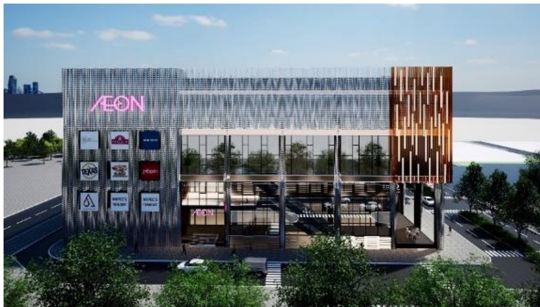
AEON Xuân Thủy nằm tại vị trí chiến lược của khu vực Cầu Giấy

Tọa lạc tại địa chỉ 122-124 đường Xuân Thủy, phường Dịch Vọng Hậu, quận Cầu Giấy, Hà Nội, AEON Xuân Thủy mang đến một không gian mua sắm hiện đại với đa dạng tiện ích, hỗ trợ đời sống cư dân và khách du lịch với mục tiêu trở thành điểm đến số một tại khu vực Cầu Giấy và các quận lân cận. AEON Xuân Thủy chú trọng cung cấp các mặt hàng và dịch vụ thiết yếu, phù hợp với nhu cầu của người dân. Đồng thời, trung tâm cũng cam kết mang đến trải nghiệm tốt nhất cho khách hàng, tạo dựng dấu ấn riêng biệt và bản sắc độc đáo chỉ có tại AEON.