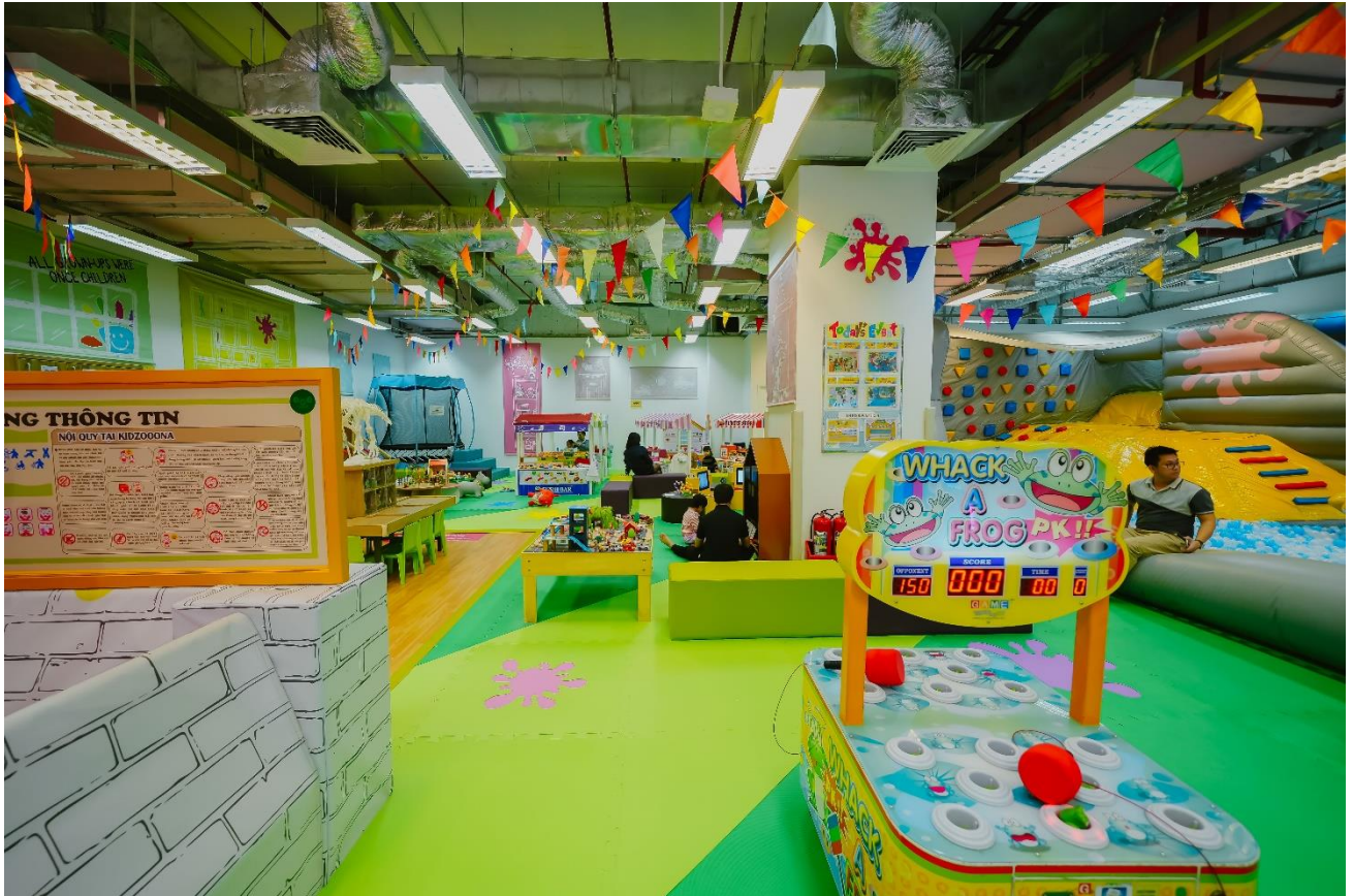
Khu vực trẻ em rộng 308m 2 tại AEON Xuân Thủy