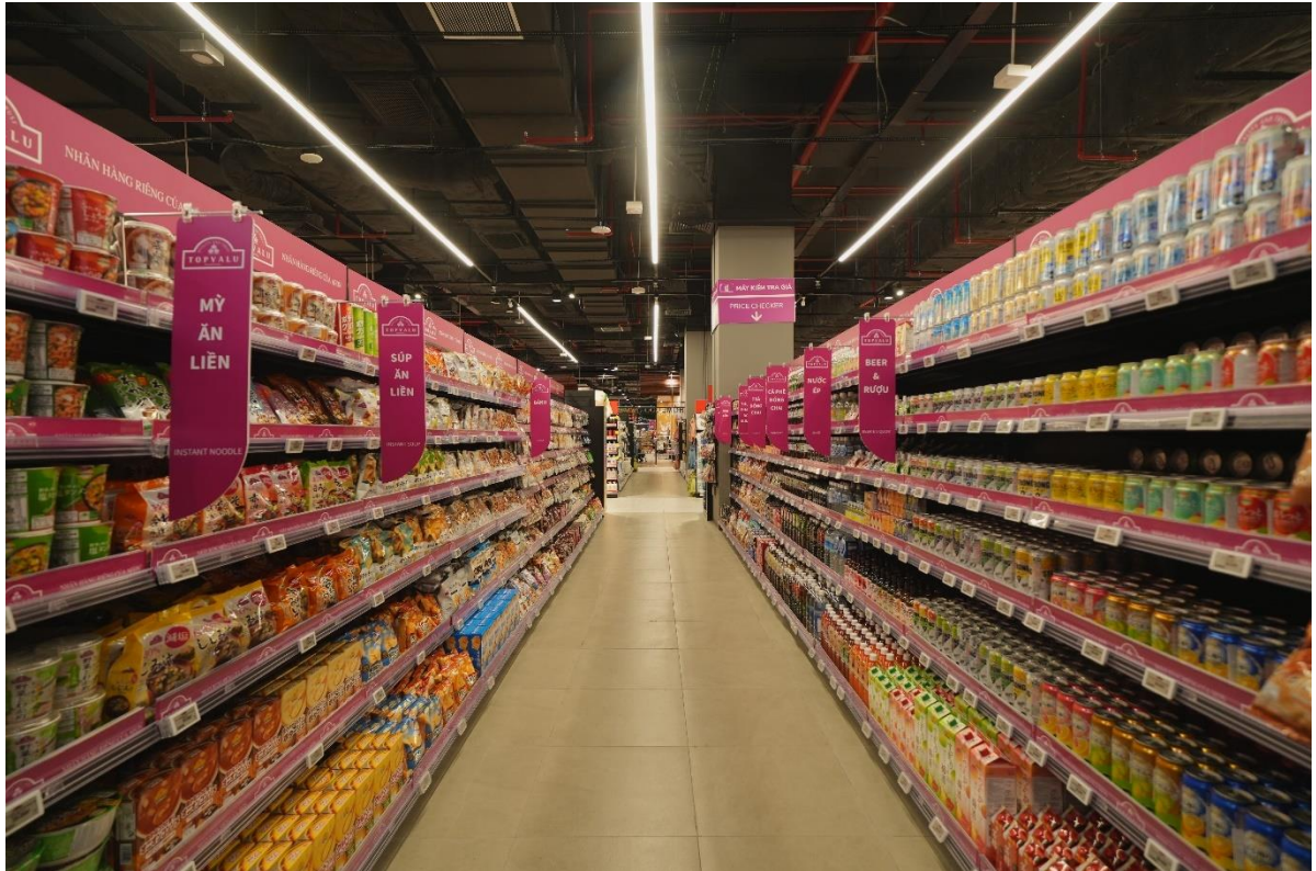
“Con đường” TOPVALU giới thiệu các sản phẩm nhãn hàng riêng của AEON