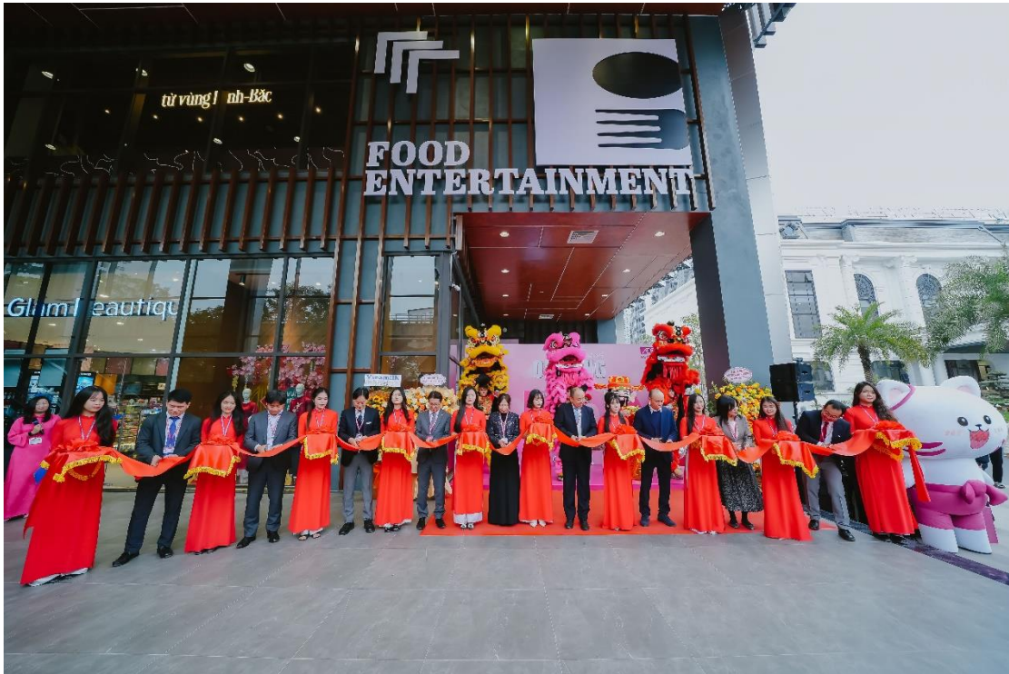
AEON Xuân Thủy chính thức khai trương ngày 10/01/2025

Công ty TNHH AEON Việt Nam (viết tắt là “AEON Việt Nam”) chính thức khai trương AEON Xuân Thủy, Trung tâm Bách hóa Tổng hợp và Siêu thị thứ 9 (viết tắt là “TT BHTH & ST”) của AEON tại Việt Nam. AEON Xuân Thủy mang đến không gian mua sắm và trải nghiệm sôi động, kết hợp hài hòa khu thiên đường ẩm thực với hơn 10 thương hiệu, khu cửa hàng chuyên doanh giới thiệu những sản phẩm thời trang mới nhất tích hợp khu giải trí, cùng siêu thị AEON cung cấp đầy đủ tất cả những sản phẩm thiết yếu phục vụ cho cuộc sống hàng ngày, sẵn sàng đáp ứng mọi nhu cầu của khách hàng. Xác định Việt Nam là thị trường trọng điểm thứ hai bên cạnh Nhật Bản trong chiến lược trung và dài hạn, Tập đoàn AEON tăng tốc mở rộng đa dạng mô hình kinh doanh, đáp ứng nhu cầu và điều kiện thực tế của từng khu vực.