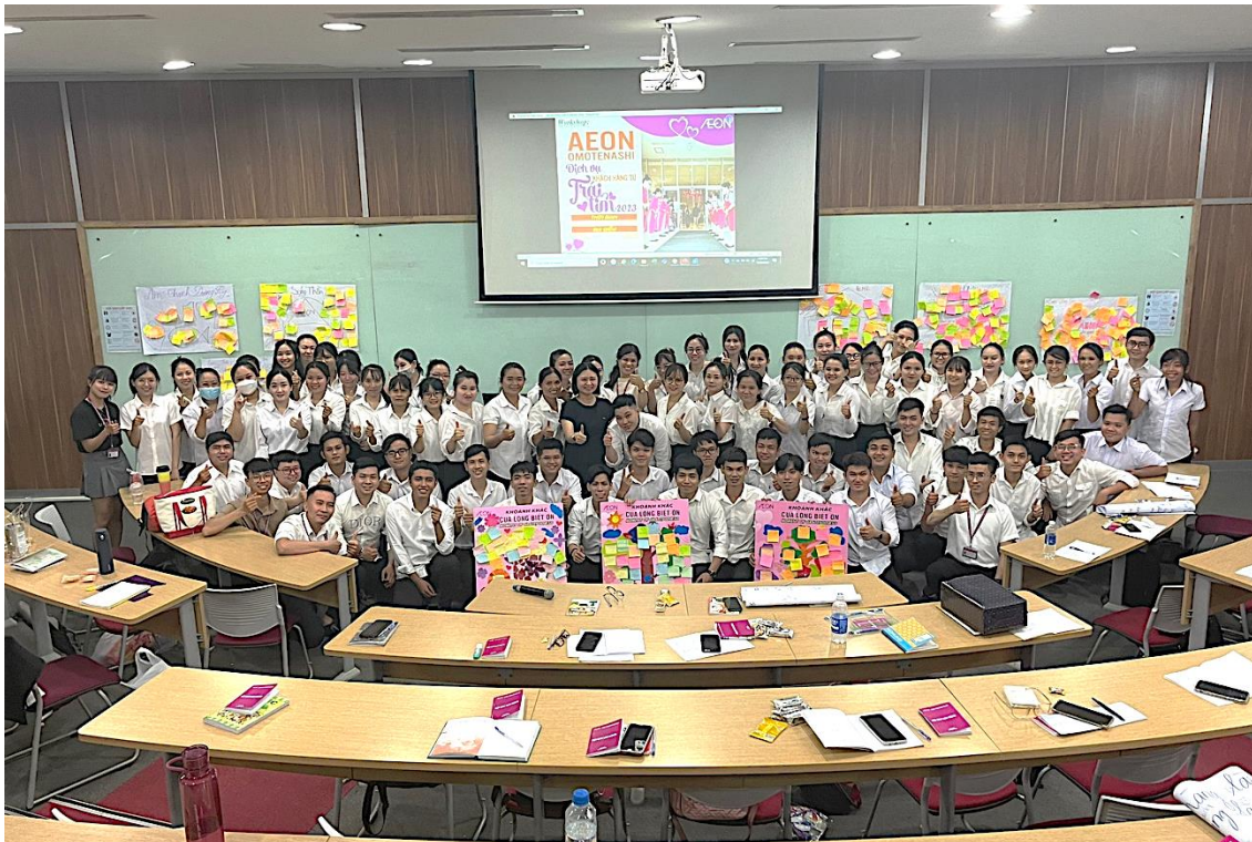
Chương trình đào tạo nhân viên mới của Siêu thị AEON Bình Dương New City đảm bảo chất lượng phục vụ khách hàng