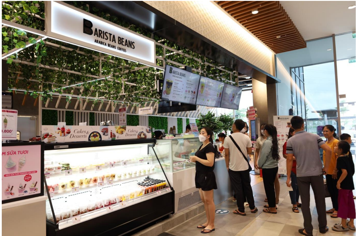
Khu vực Barista Beans tại AEON Bình Dương New City chuyên phục vụ cà phê thơm ngon cùng nhiều loại trà, bánh ngọt

Khu ẩm thực tự chọn Delica có diện tích hơn 710m 2 với sức chứa 90 chỗ ngồi, là địa điểm lý tưởng để các gia đình, nhóm bạn bè tụ họp, chủ động lựa chọn món ăn theo sở thích từ đa dạng nền văn hóa Nhật Bản, Hàn Quốc, Thái Lan cùng các quầy salad bar, các loại sushi,... khu vực Barista Beans chuyên phục vụ cà phê thơm ngon cùng nhiều loại trà, bánh ngọt khác nhau, hứa hẹn đáp ứng nhu cầu của mọi đối tượng khách hàng.