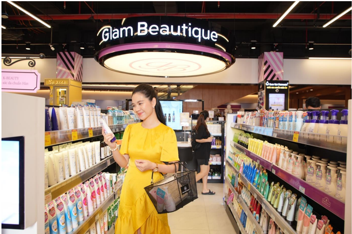
Glam Beautique - Cửa hàng chuyên doanh thuộc Chuỗi cửa hàng Chăm sóc sức khỏe và sắc đẹp của AEON Việt Nam – cũng đã có mặt tại AEON Bình Dương New City