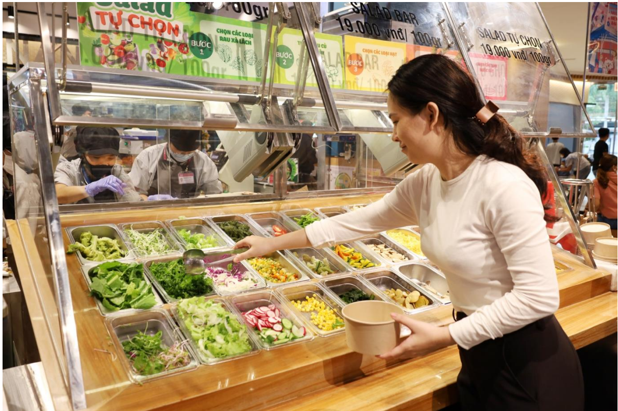
Quầy salad tại Siêu thị AEON Bình Dương New City