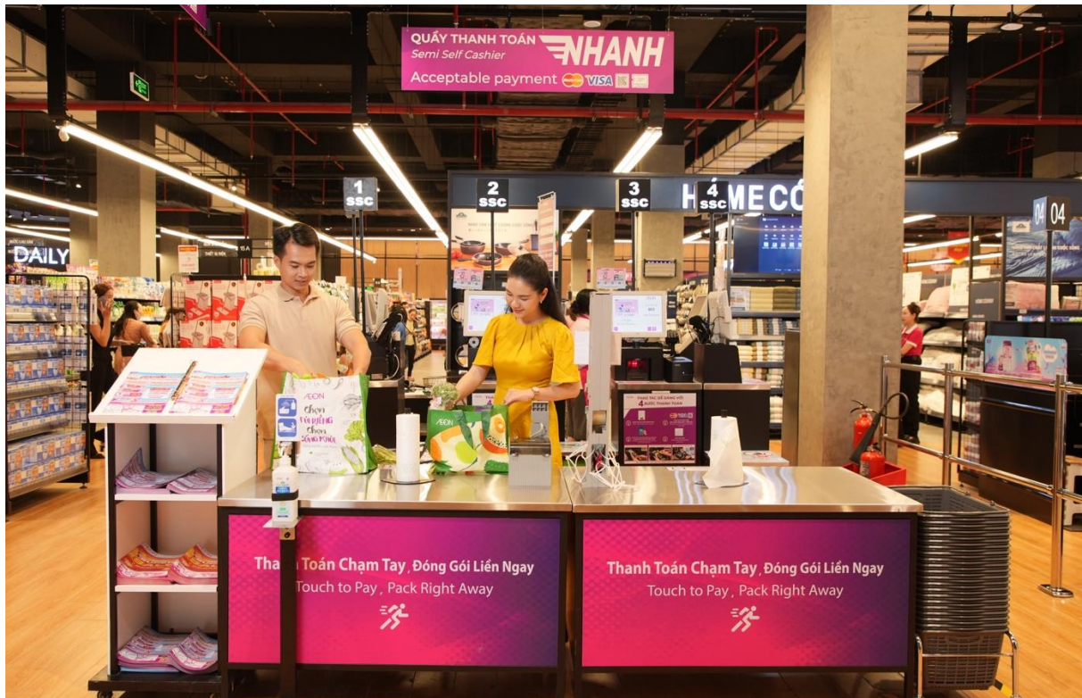
Quầy thanh toán nhanh tại Siêu thị AEON Bình Dương New City

Nhằm mang đến sự thuận tiện, nhanh chóng cho khách hàng theo xu hướng chuyển đổi số, tại AEON Bình Dương New City tích hợp các tiện ích công nghệ qua các trang thiết bị như: tủ chứa đồ thông minh, máy chọn món tự động, quầy thanh toán bán tự động.