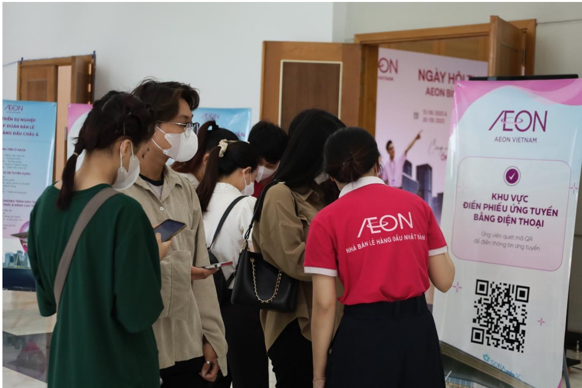
Ngày hội Tuyển dụng của Siêu thị AEON Bình Dương New City diễn ra vào 2 ngày 13 và 20 tháng 5 tại Thành phố Mới Bình Dương