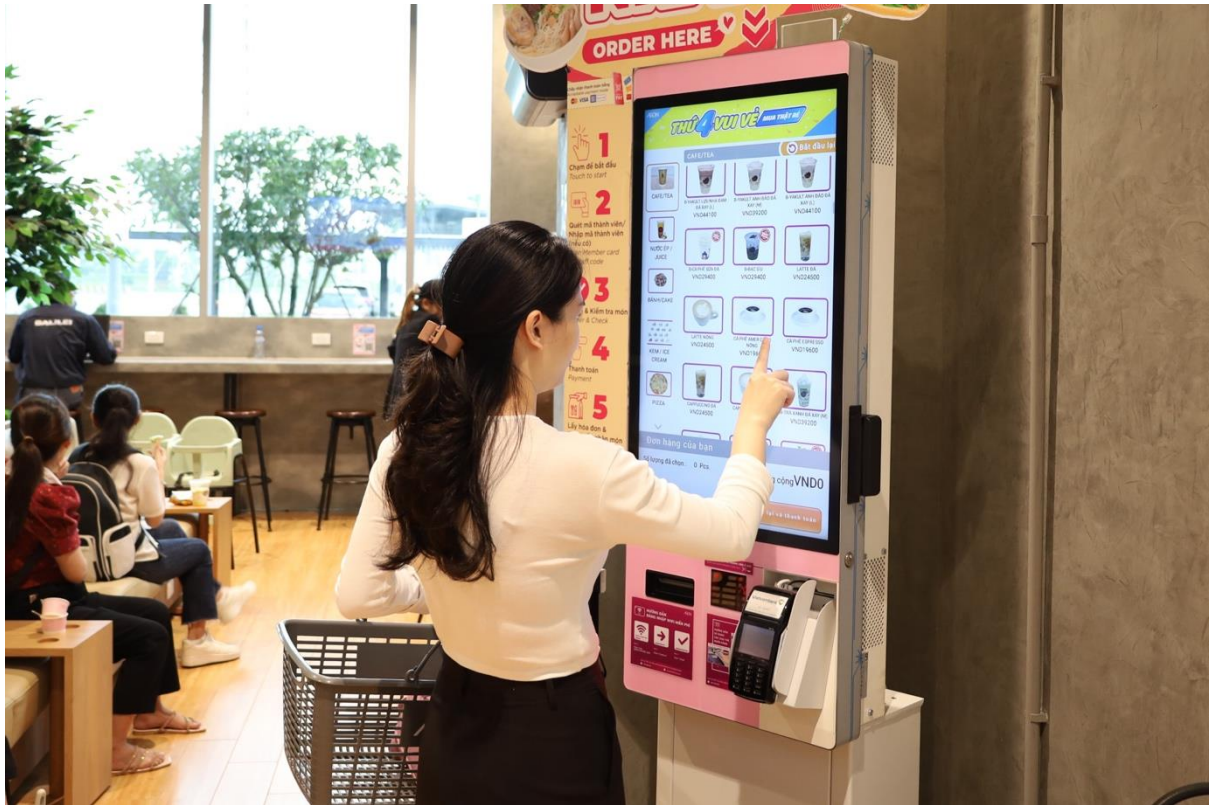
Khách hàng trải nghiệm Máy chọn món tự động tại Siêu thị AEON Bình Dương New City